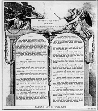
Déclaration des droits de l'homme